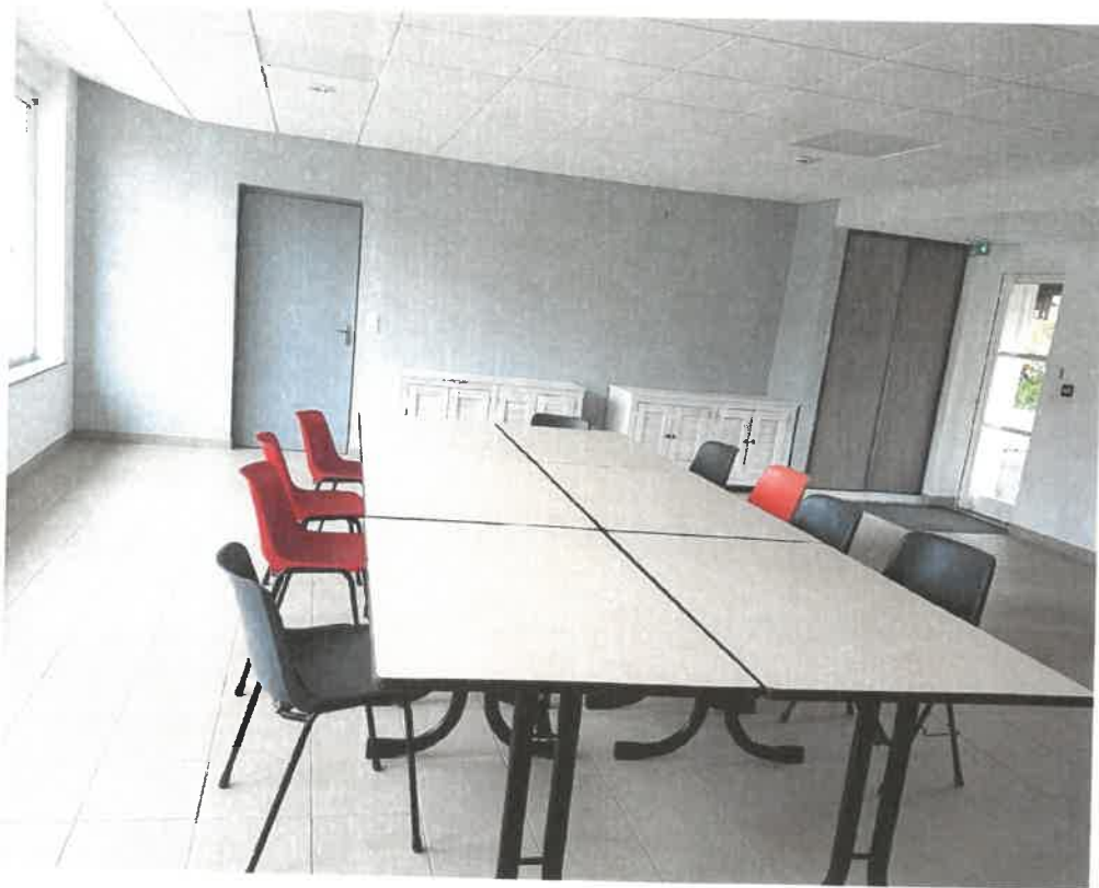
Salle polyvalente de RUHANS